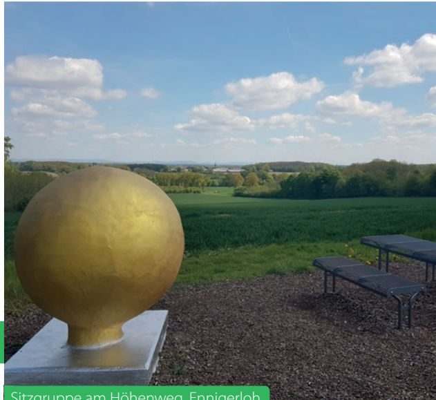
Sitzgruppe am Höhenweg, Ennigerloh