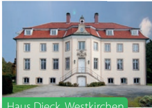
Haus Dieck, Westkirchen